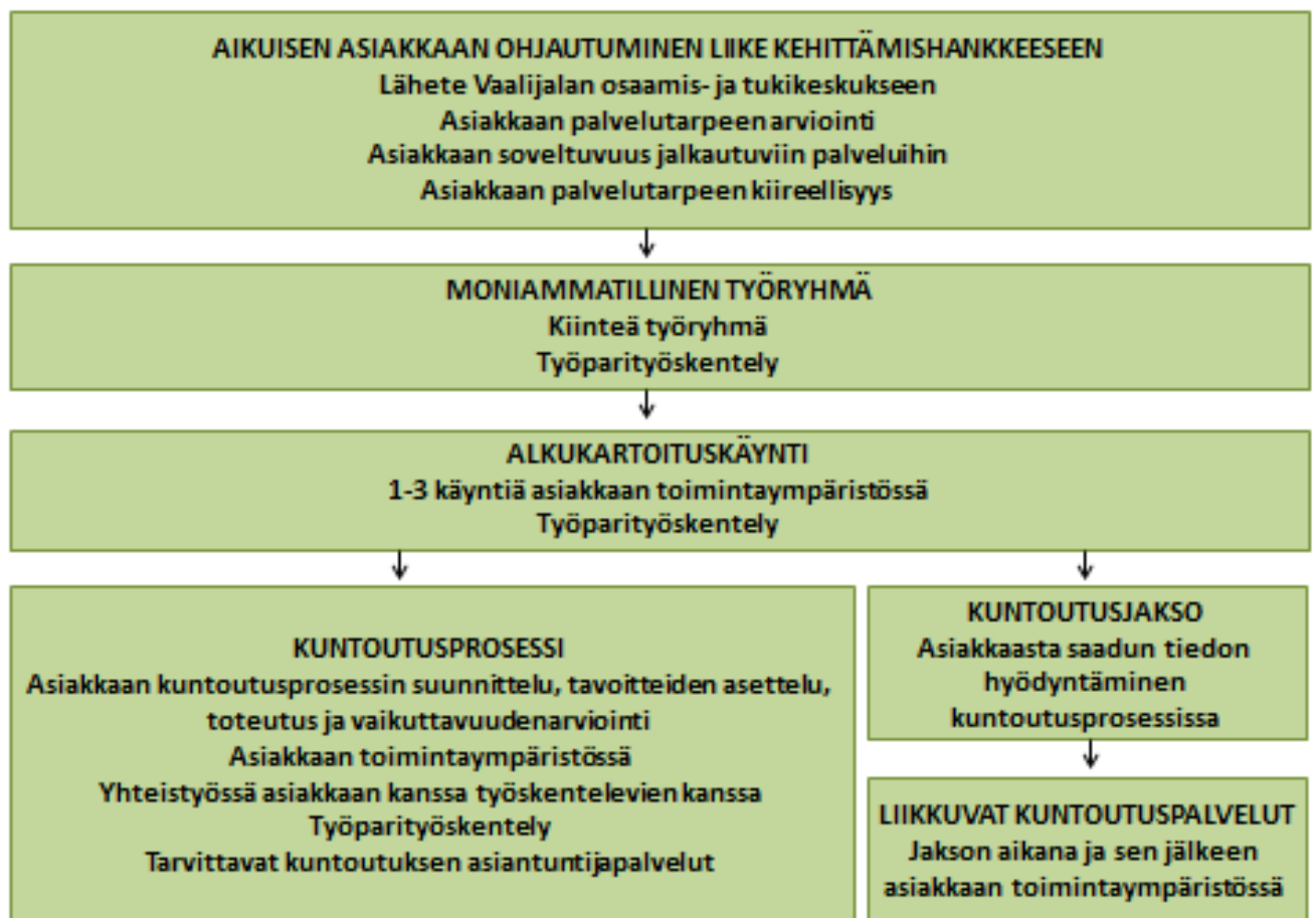
KUVA 3 ”Aikuiset ja heidän lähiyhteisönsä”-osahanke

”Aikuiset ja heidän lähiyhteisönsä”-osahankeen tavoitteena on kehittää uudenlaista toimintatapaa, jossa asiakkaan kuntoutustarve arvioidaan alkukartoituskäynneillä ja pyritään suunnittelemaan kuntoutus hänen omaan toimintaympäristöönsä. Tavoitteena on tarjota asiakkaalle ja hänen lähiyhteisölleen tukea, ohjausta, konsultaatio ja kuntoutusta asiakkaan omaan toimintaympäristöön. Mikäli asiakkaan kuntoutustarve kuitenkin vaatii laitospalvelujaksoa, on alkukartoituskäynneillä saatu arvokasta tietoa asiakkaasta, lähiympäristön toiminnasta sekä mahdollisista tekijöistä, jotka ovat vaikuttaneet asiakkaan kuntoutustarpeen syntyyn. Osahankeen tavoitteena on vähentää laitospalvelujaksoja ja vahvistaa asiakkaan lähiyhteisön osaamista.